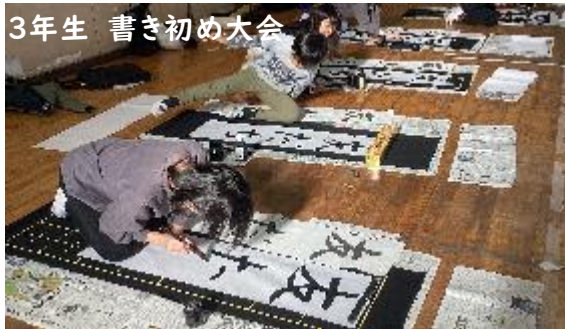
3年生 書き初め大会

3年生：友だち 4年生：明るい心 5年生：新しい風 6年生：四字熟語 書き初め大会、体育館は、静けさの中・・・子どもたちが書き初めに向き合う姿に、凛とした雰囲気がありました。完成した作品はどれも力作ぞろいです。書き初め展をご観覧いただきました、ご家族のみなさま、