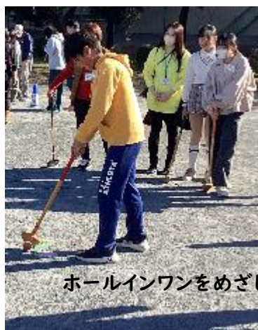
ホールインワンをめざして頑張りました。