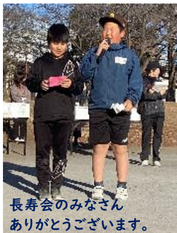
長寿会のみなさん ありがとうございます。

当日は、穏やかな天候に恵まれ、東柏ケ谷近隣公園に、6年生とご家族、長寿会をはじめとした地 域のみなさま、本校の教職員、PTAが参加し、総勢約250名が集い、和やかな雰囲気の中にも、ホー ルインワンをめざして真剣な表情でプレイに取り組む参加者の姿がみられました。