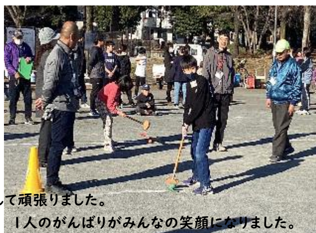
1人のがんばりがみんなの笑顔になりました。