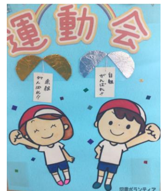
ポスター 図書ボランティアさんより

去年の応援団長は、負けていても一生けん命に声えんを送っていました。その姿にあこがれて、団長になりました。今年も、どんな時でも声を大きく、みなさんの力になれるように精いっぱいがんばります。赤組のみなさんで力を合わせて優勝を目指しましょう。