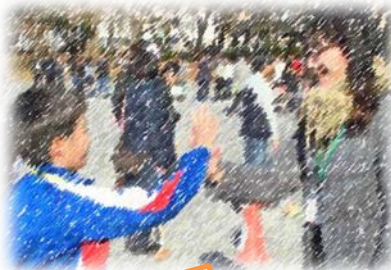
笑顔で ハイタッチ

1月18日(水)に三世代交流グラウンドゴルフ大会が行われました。当日は、多くの方々に協力をしていただき、ありがとうございました。会場準備やゲームの進行では、長寿会の方々に中心となって協力していただきました。また、PTAの方々を中心に、機材の搬入や豚汁づくりもしていただき、地域の方々の支えによって、たくさんの笑顔があふれる大会となりました。ご参加・ご協力いただいた皆様、ありがとうございました。