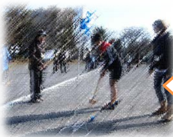
ホールインワン賞を もらいました