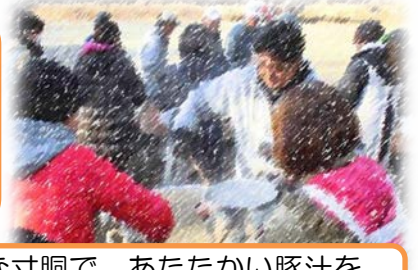
とても大きな寸胴で、あたたかい豚汁を つくっていただきました