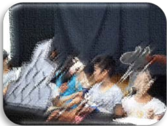
人形劇体験教室（高学年）