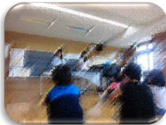
リトミック（低学年・高学年）