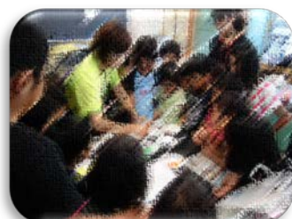
いろいろ色めり教室（低学年）