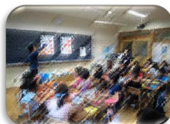
調理員さんと折り紙（低学年）