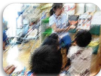
図書（低学年・高学年）