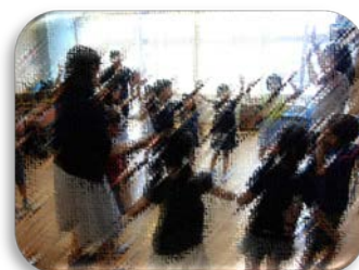
えいごであそぼう（低学年）