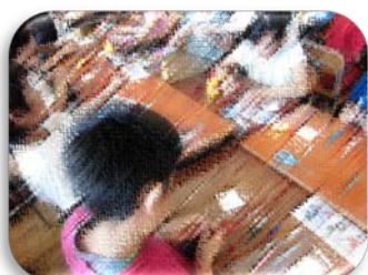
ペーパークイリング（高学年）