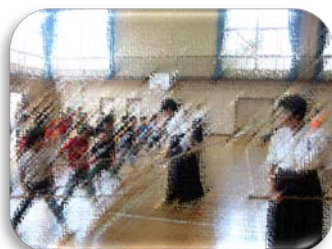
なぎなた体験（低学年・高学年）