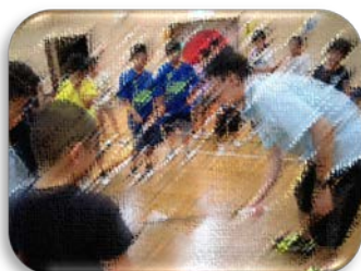
バドミントン（高学年）