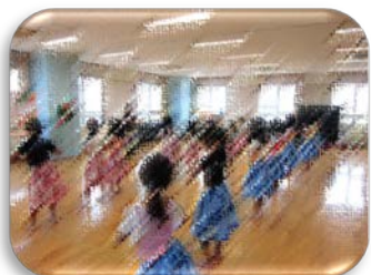
フラダンス（低学年・高学年）