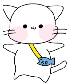
50周年 マスコットキャラクター 「とはにゃん」