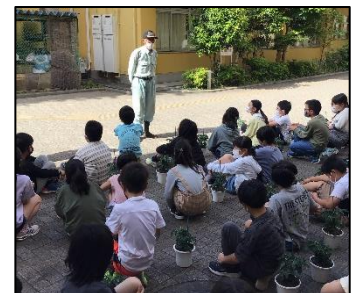
育てるポイントを教わりました。