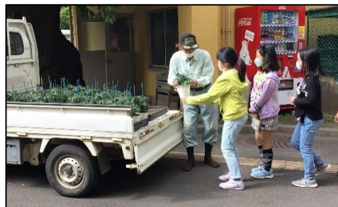
一人一鉢、丁寧に、手渡していただきました。